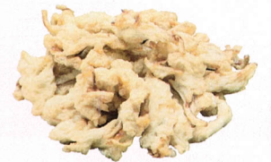
かきあげかまぼこ