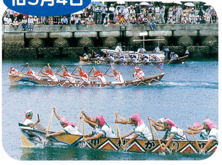
ハーレー(ハーリー)