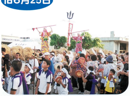
つなひ カシチー綱引き