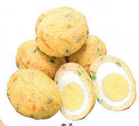
くがに丸 (たまご入り)