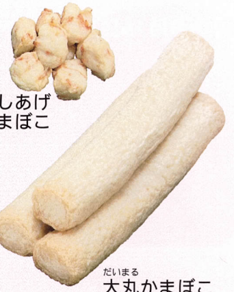
だいまる 大丸かまぼこ