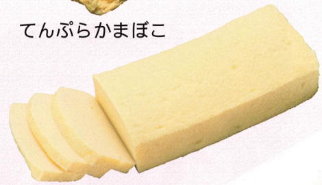
てんぶらかまぼこ