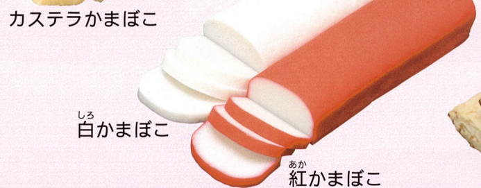
カステラかまぼこ