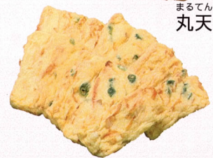
まるてん 丸天 (ぼーぼー)