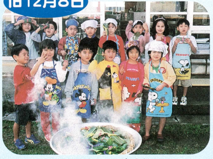
ぎょうじ ムーチー行事