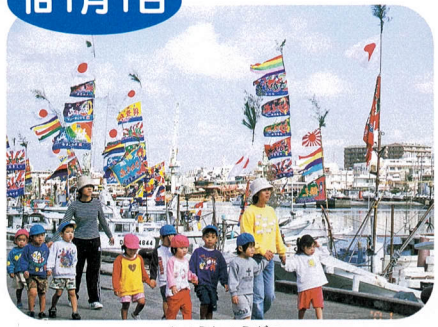
きゅうしょうがつ 旧正月