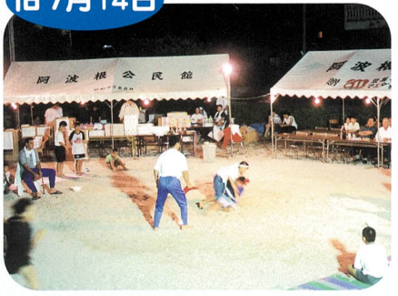
おきなわ 沖縄すもう