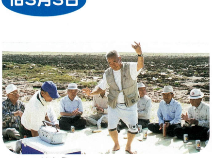
はまう 浜下り(ピーリンポーリン)