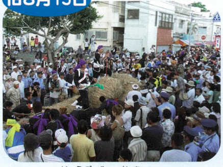
じゅうご やつなひ 十五夜綱引き